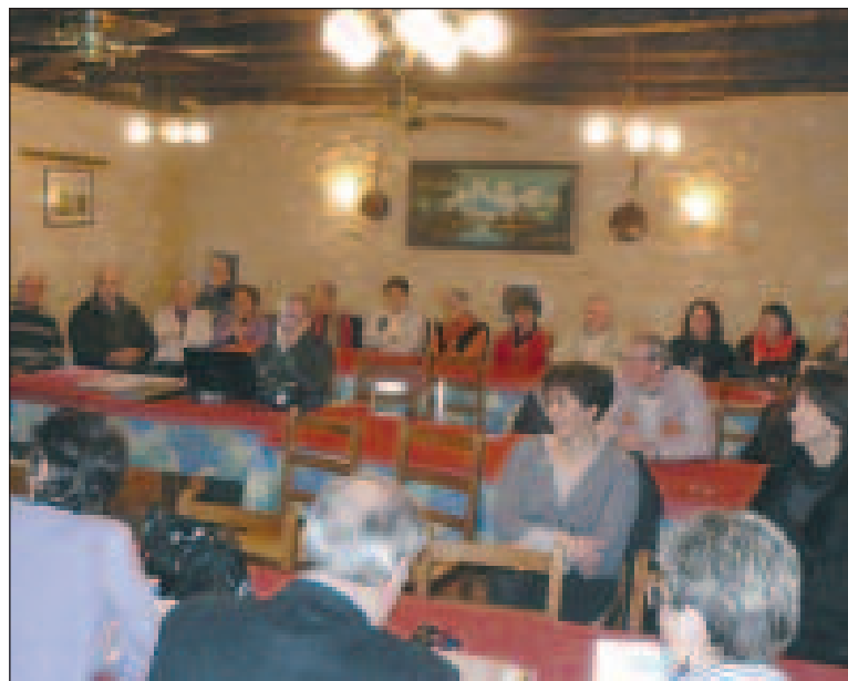
L'assemblée studieuse prend connaissance des bilans