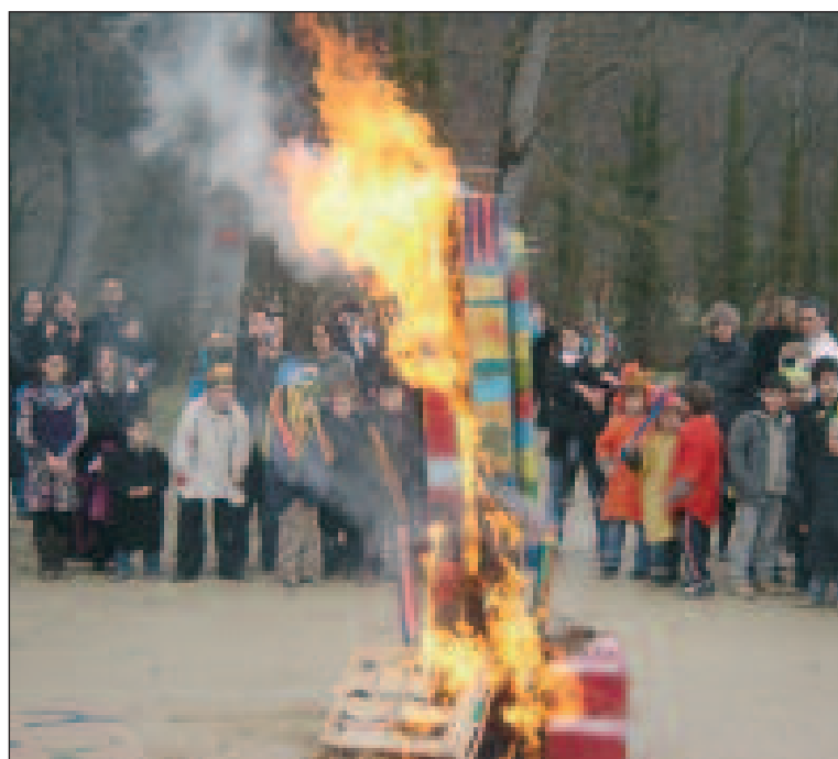
Pétassou sur le bûcher