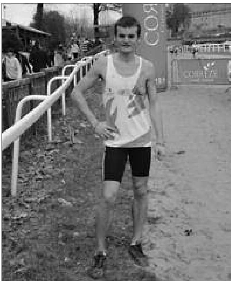
A l'arrivée du cross à Pompadour

Champion de Dordogne en 2007 et en 2008 en catégorie minimes, puis en 2009 et en 2010 en cadets, il est monté sur la troisième marche