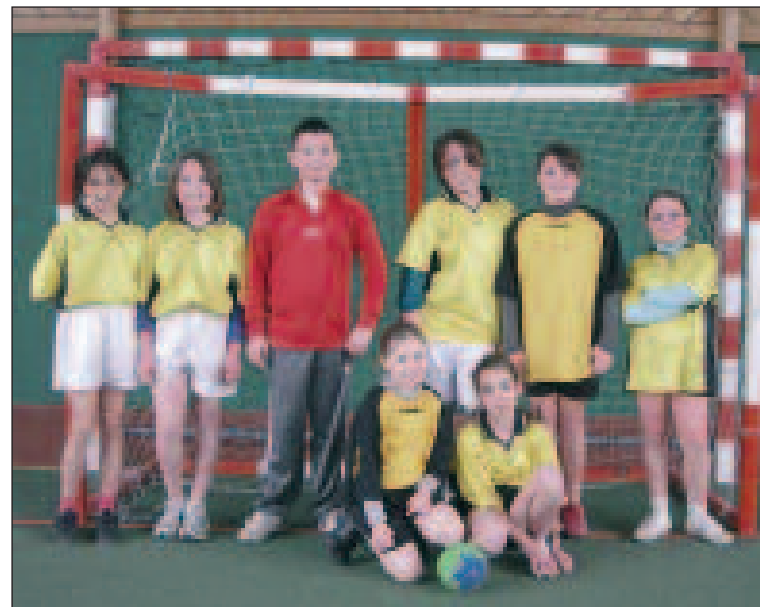
Une équipe mixte qui n'attend que de nouvelles adeptes